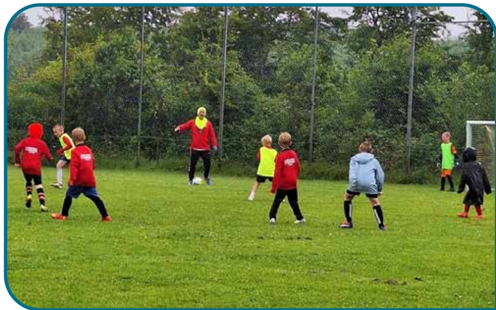
U7/8 drenge til træning i regnvej – den fedeste træning jf. drengene