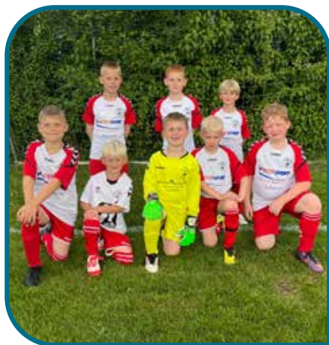
Hellevad IF U8 drenge