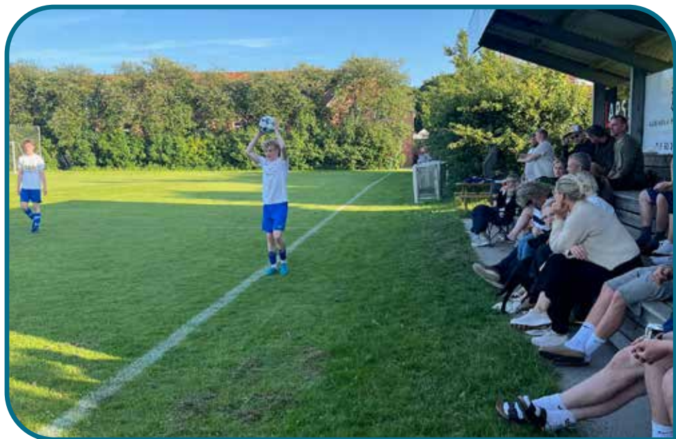
Seniorholdet til den sidste hjemmekamp i forårssæsonen med en fyldt Kaj Homilius Tribune