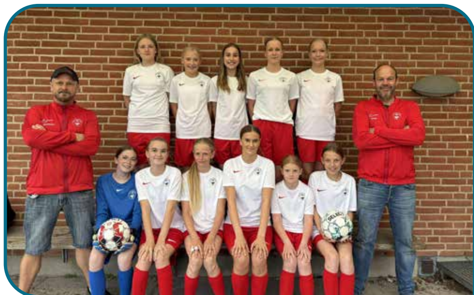
Hellevad IF U12-14 piger i deres nye spillersæt inkl. to seje trænere