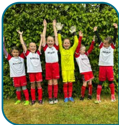
Hellevad IF U7/8 pige