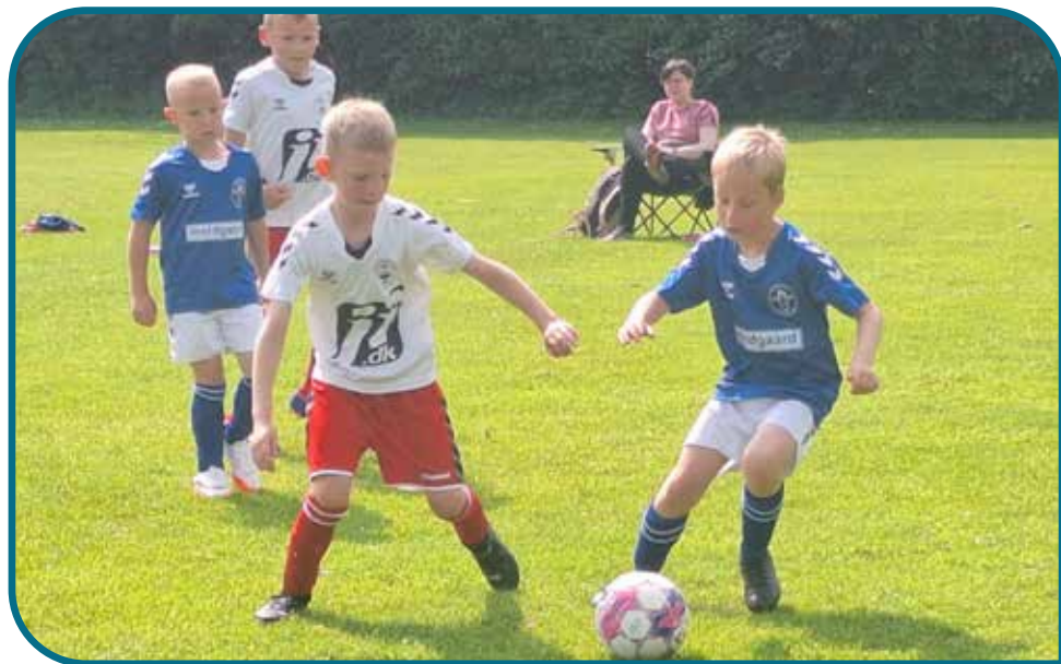
Hellevad IF U7 drenge